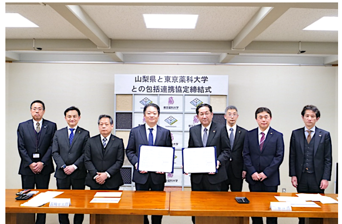
(山梨県ならびに東京薬科大学出席者一同)

両機関は共同で、山梨県における質の高い薬剤師の確保を進めるとともに、薬剤師が生涯にわたって職能を研鑽する学習機会の提供、感染症予防対策、健康・医療等に関する調査・研究を行うことで、健康と福祉の分野で連携してまいります。また、薬学部と生命科学部を併設し、より高度な理系専門教育を行う大学としての特性を活かし、山梨県内の中・高校生を対象とした理系人材の育成に取り組み教育分野での人材育成を進めます。さらに、地域の産業と健康領域を融合させた健康食品や環境分野をはじめとした産業振興、大規模災害発生時における被災者の健康確保の支援など、地域課題の解決に取り組みます。