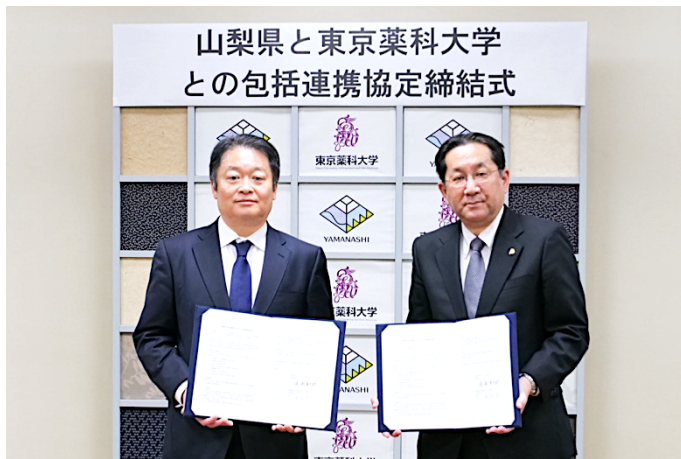
(左:長崎幸太郎知事、右:三巻祥浩学長)

山梨県(知事:長崎幸太郎 所在地:山梨県甲府市)と東京薬科大学(学長:三巻祥浩 所在地:東京都八王子市)は相互に連携協力に努め、人的・知的資源の交流及び活用を図ることで「地域に貢献できる薬剤師等の人材を育成する」とともに、地域の活性化、地域課題の解決とそれに資する教育・研究等、相互の発展に寄与することを目的として2024年3月13日付で包括連携協定を締結しました。